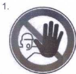
Nepovolánym vstup zakázaný (spolu so značkou č.2, 3 alebo 4 a príslušnou dodatkovou tabuľou)